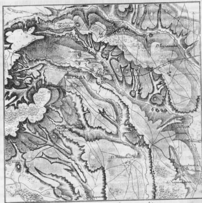
Схема № 1.

Планъ, котораго рѣшилъ держаться Красовскій, заключался въ слѣдующемъ.