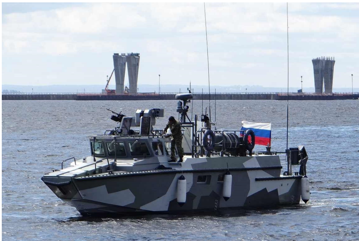
Рис. 4. БК-16» на Международном военно-морском салоне МВМС-2015