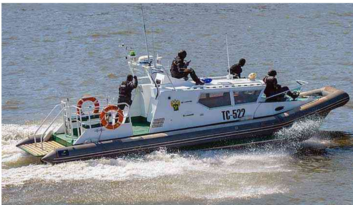
Рис. 7. Бронированный десантно-штурмовой катер «Стриж 4-1ДШ»