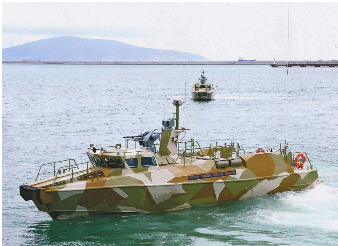
Рис. 2. «Рапторы» в Новороссийске