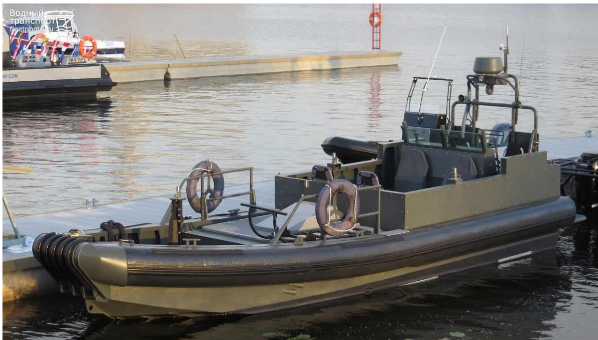
Рис. 6. Бронированный катер огневой поддержки БК-9