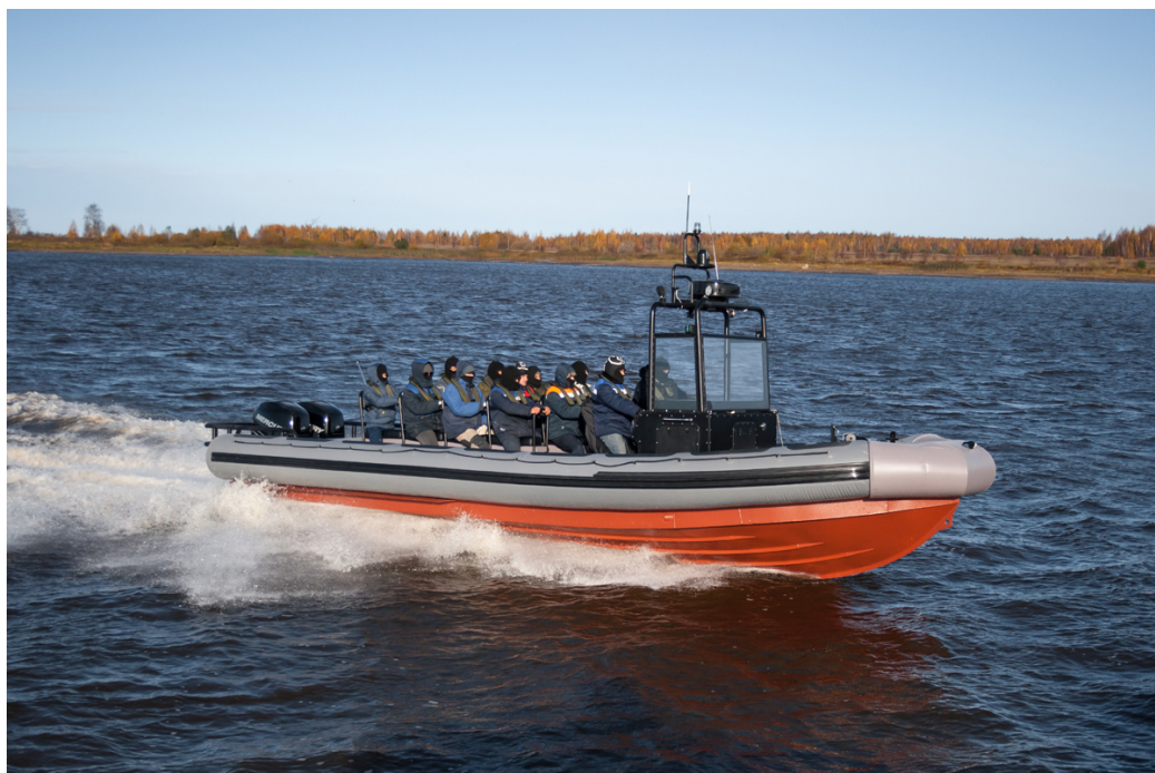
Рис. 5. Скоростной десантно-штурмовой катер открытого типа проекта БК-10