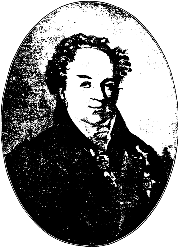
Князь Алексѣй Борисовичъ Куракинъ, первый Малороссійскій генераль-губернаторъ.