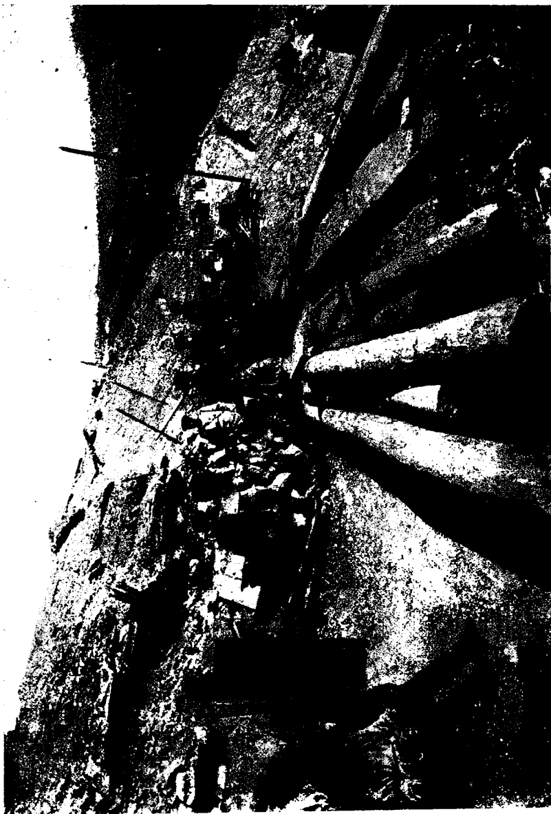
Тыловая дорога на Высокой горѣ которую въ нашей литературѣ называютъ высотой въ 203 метра.

По прибытіи ротъ комендантъ поставилъ ихъ такъ: 1-ю роту 28-го полка и половину 11-й роты 27-го полка въ окопы для сгущенія людей на правомъ флангѣ, остальные поставлены въ резервъ.