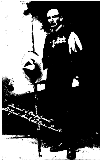
Генераль Баденъ-Пауль въ формѣ старшаго скаута.