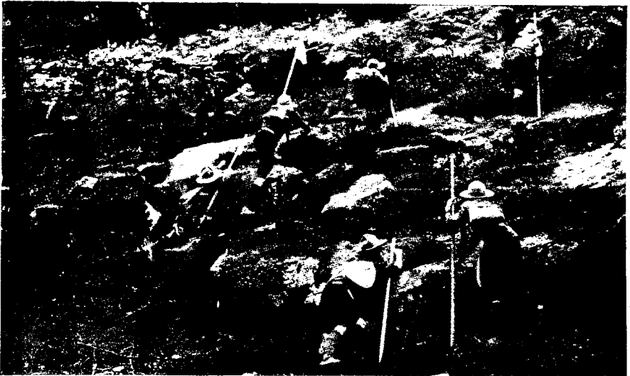
АНГЛИЯ. Игра «контрабандисты через границу». Девочки-скауты (гёрл-гидъ) также принимают участие в играх; большею частью отдельными отрядами.