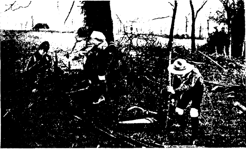
АНГЛИЯ. Бой-скауты чинят изгородь поселянину.