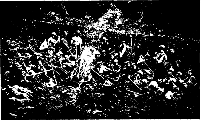
АНГЛІЯ. Весѣда «у костра».