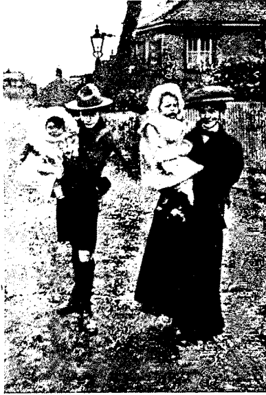
АНГЛИЯ. Вой-скаутъ помогаетъ дамѣ нести ребенка.