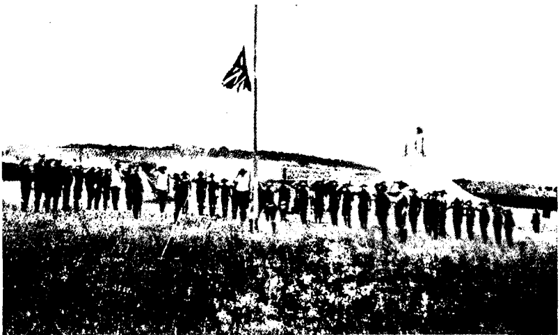
АНГЛІЯ. Отданіе чести флагу въ лагерѣ бой-скаутовъ.