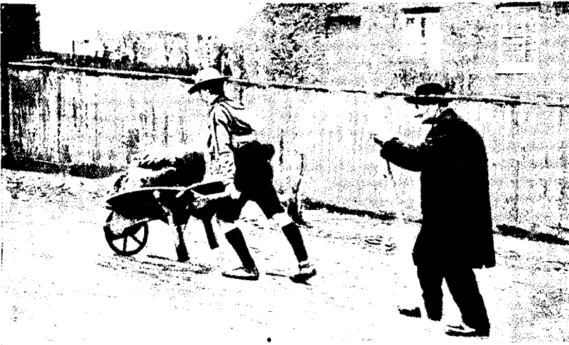
АНГЛИЯ. Бой-скаутъ везетъ тачку старика.