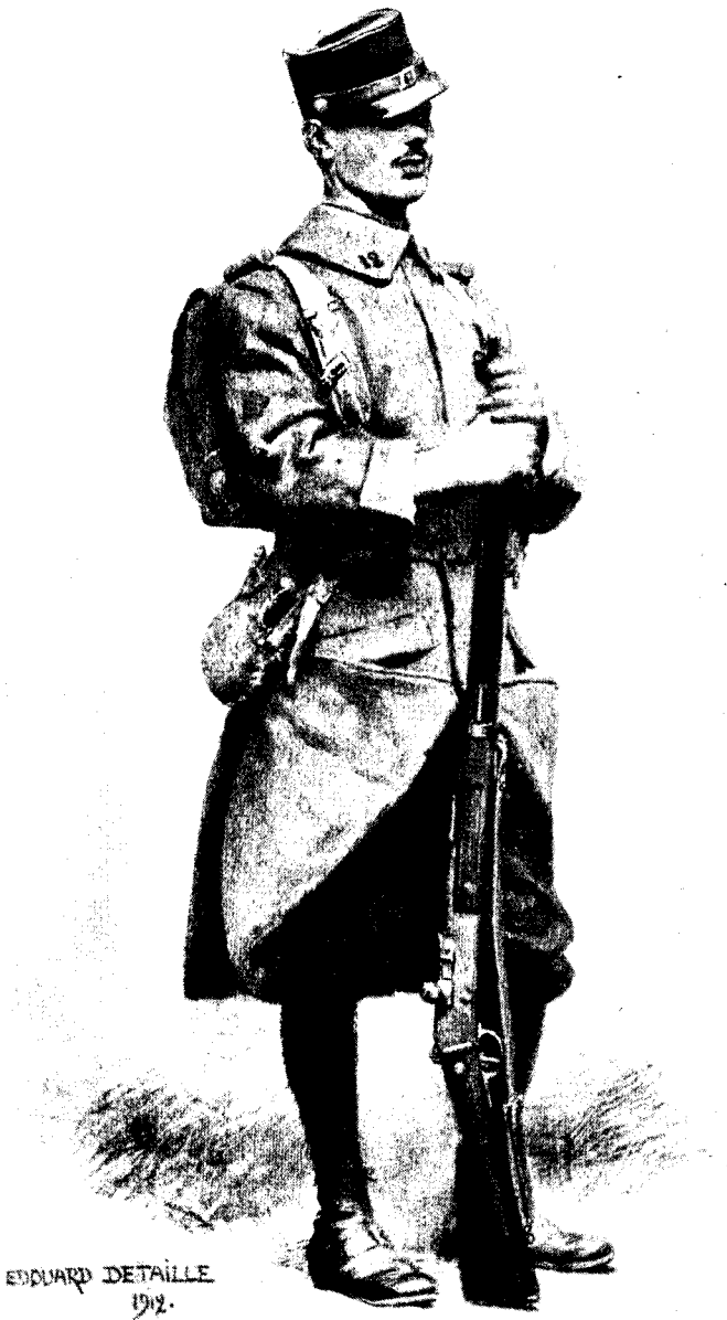
ФРАНЦІЯ. Новая походная форма пѣхотинца, спроектированная художникомъ Детайлемъ. («Illustration»).