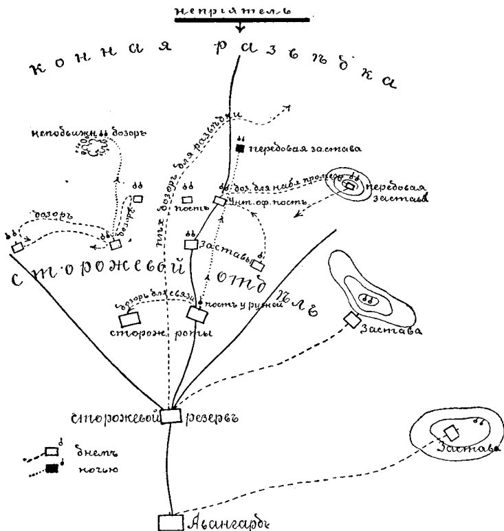
Схема сторожевого охраненія въ германской арміи.

Посты у нихъ всѣ двойные, причемъ нѣтъ подраздѣленій на часового и подчаска.