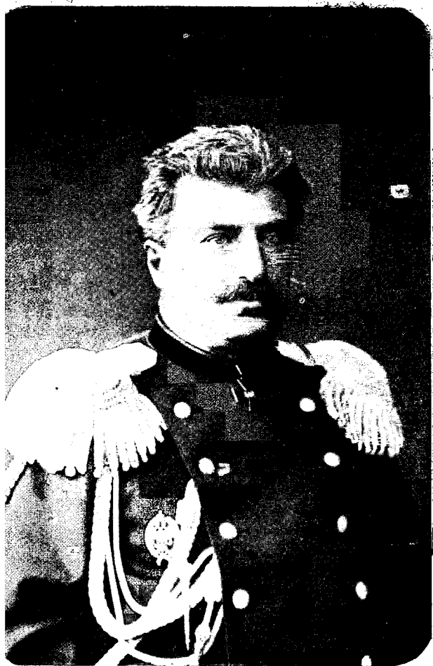
Николай Михайлович ПРЖЕВАЛЬСКИЙ.