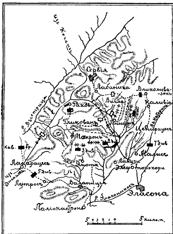
Схема № 3.

арміи—Македонской и Эпирской. Въ виду сего главный ударъ былъ направленъ противъ турецкаго праваго фланга: правофланговый греческій отрядъ Константинопулоса долженъ былъ слѣдовать на Влахоливазонъ и отсюда по дорогѣ на Лабаника по возможности въ тылъ противника; 1-я дивизія направлена на Каливию для атаки отсюда лѣваго фланга турокъ; для атаки ихъ праваго фланга и Гликована назначались 2-я и 3-я дивизіи, а 4-я должна была слѣдовать въ обходъ его изъ Яноты на Макронъ и Рахово; 6-я дивизія оставалась въ резервѣ на дорогѣ между Мались и Лакузи; 5-я дивизія, имѣя