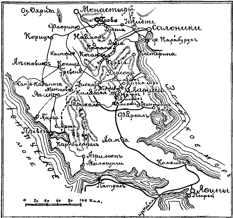
Схема № 1.

ринѣ (на берегу моря). Прочія дороги черезъ перевалы носятъ характеръ горныхъ дорогъ и очень затруднительны для движенія войскъ. Для турокъ въ этомъ районѣ главною базой являлись Салоники, а важнымъ стратегическимъ пунктомъ была Кочана, гдѣ сходятся дороги изъ Салоникъ, Монастыря и съ второстепеннаго театра въ Эпирѣ—изъ Янины.