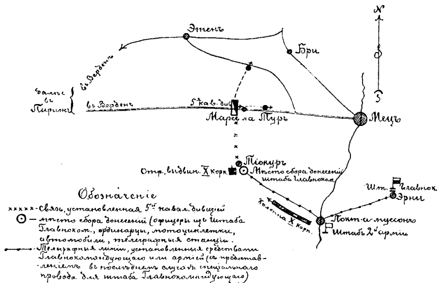
Схема предполагаемаго расположенія штаба сбора донесеній штаба Главкома командующаго и связи въ обстановкѣ расположенія немецкихъ войскъ 15 авг. 1870 г.

такъ безусловно нужнымъ прочное виѣдреніе въ сознание войскъ, что въ современную эпоху, когда высшее командованіе вынуждено работать только по картѣ, когда обстановка вырисовывается только изъ сопоставленія многочисленныхъ донесеній, добытыхъ войсковою развѣдкой съ разныхъ точекъ наблюденія, настоятельно необходимо постоянное ориентированіе старшаго начальника въ происходящемъ. Вполнѣ правильнымъ является требованіе нашего полевого устава (§ 25), возлагающее обязанность отдѣляющагося подчиненнаго связываться со старшимъ начальникомъ и такимъ образомъ возлагающее и отвѣтственность за поддержаніе связи на него же 10) . Но я хотѣлъ здѣсь указать на то, что это только одна сторона дѣла. Нельзя не считаться съ жизнью, успокаиваясь само-