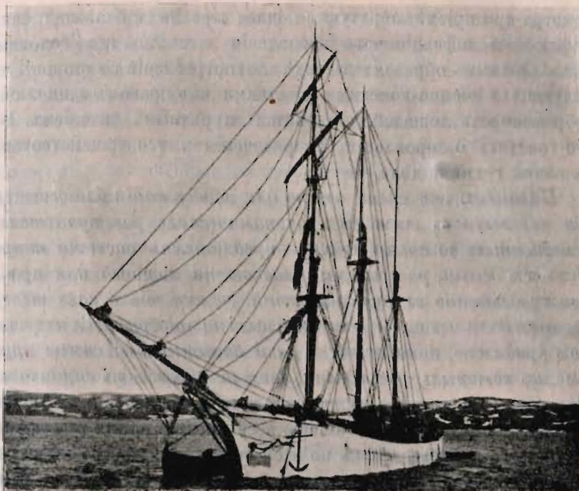
Поморское судно для дальняго транспорта соленой рыбы (въ Балтійскіе порты).