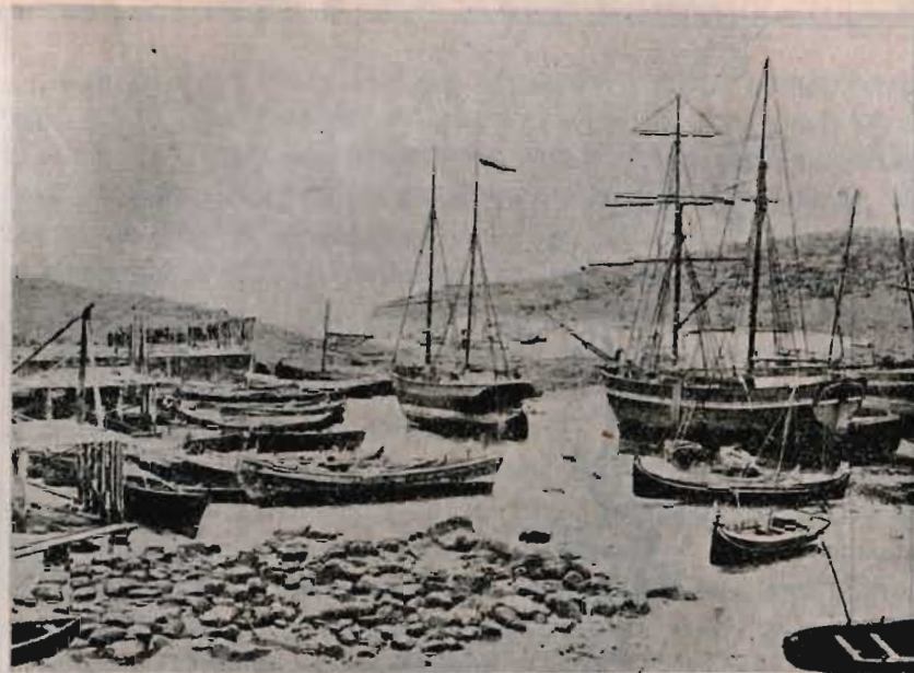
Становище Поморскаго флота — Гаврилово на Мурманѣ.