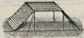
Три вида комбинацій разбивки палаточныхъ полотнищъ.