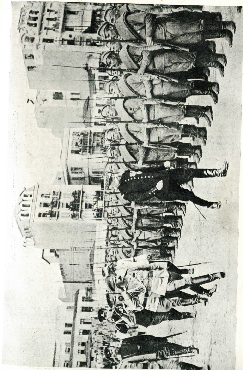
Русскія войска въ Солуни.