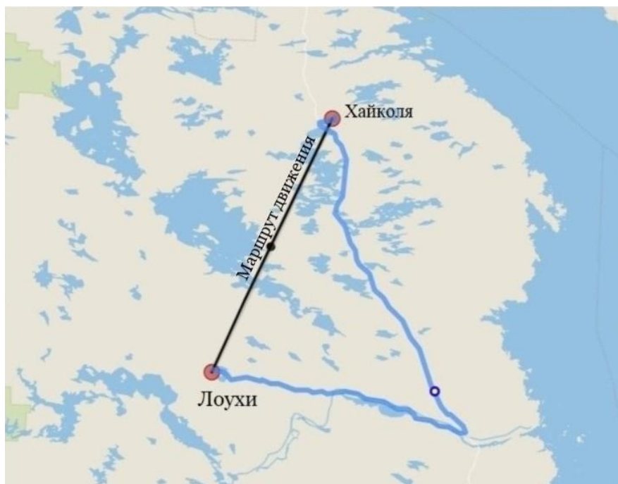
Рис. 2. Маршрут движения партизанского отряда «Боевой клич»

В деревне Хайколя отряд был расквартирован в теплых землянках, на территории была и собственная баня (Медведев, 1987: 59). Помимо отряда «Боевой клич», там дислоцировались отряды «Красный партизан» и «Красное знамя» (Степаков, 2004: 156). Между Хайколя и Лоухами было 110 км (Рисунок 2).