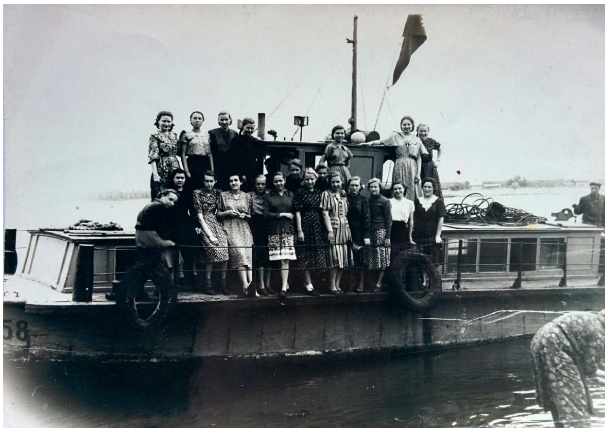
Рис. 1. Катер № 58, примерно 1950 г.