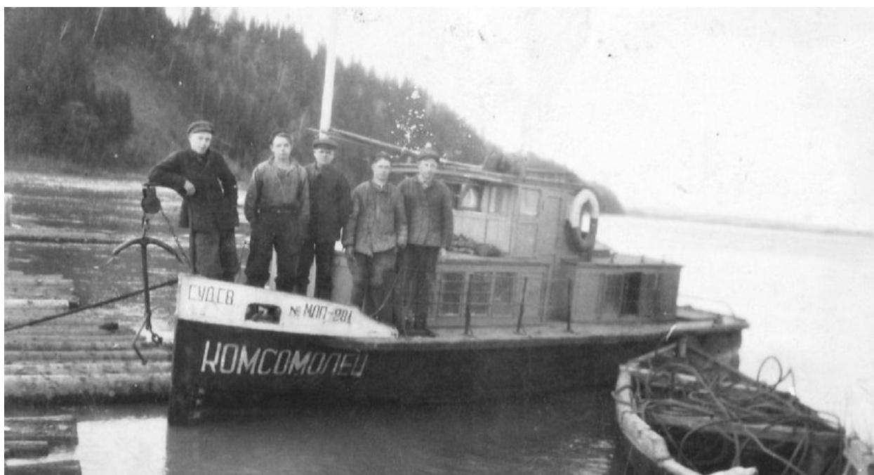
Рис. 2. Катер «Комсомолец», начало 1950-х гг.