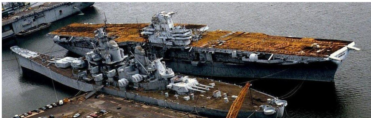
Рис. 3. Авианосец рядом с американским линкором. Видно, насколько корпус авианосца больше корпуса линкора

В описываемый период прорабатывались проекты гибридов: линкоров-авианосцев, или крейсеров-авианосцев. Из вышесказанного понятно, что создать такой корабль невозможно в принципе: или он окажется недобронированным, или с очень небольшой авиагруппой, поэтому такие проекты так и не были реализованы.