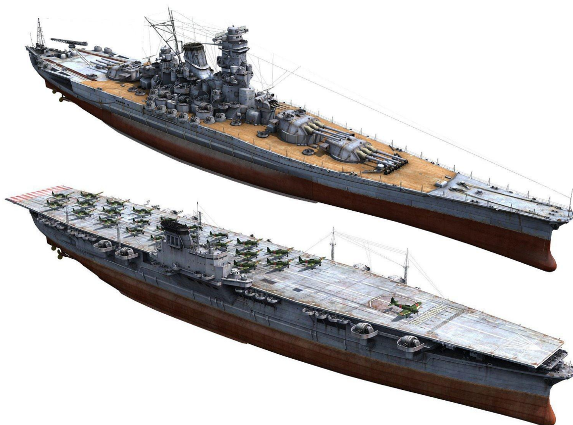
Рис. 2. Линкор «Ямато» сверху и авианосец «Синано» внизу

Продолжим анализировать корабли с похожим водоизмещением. В Таблице 4 приведены весовые нагрузки авианосца «Мидуэй» ( Балакин, 2000 ) и линкоров «Айова» и «Нью-Джерси» ( Балакин, 2003 ). В отличие, от предыдущих авианосцев, у «Мидуэй» была бронированная полетная палуба. Не смотря на это, ситуация не меняется: корпус авианосца тяжелее корпусов линкоров. Бронирование «Мидуэя» весит раза в два меньше, чем бронирование линкоров, хотя его создавали как максимально бронированный авианосец.