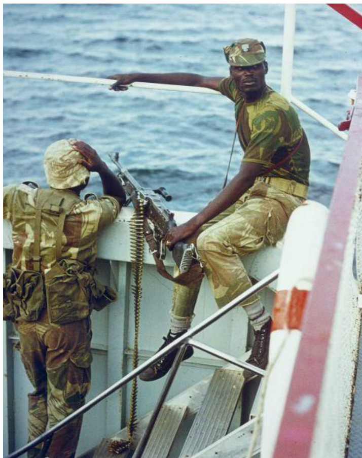
Рис. 3. Бойцы полка на патрульном катере, озеро Кариба, 1976 год

конфликта, даже после усиления в конце 1970-х годов боевых действий. В таких условиях личный состав ( Рисунок 3 ) родезийского африканского полка постоянно был задействован для борьбы с растущим числом повстанцев ( Stewart, 2011: 23 ).