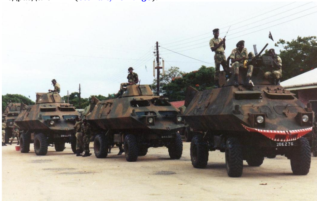
Рис. 4. Бойцы полка на родезийских «призраках», 1980 год

правительству слишком поздно, несмотря на ранние рекомендации по этому поводу изнутри подразделения» (Stewart, 2011: 138).