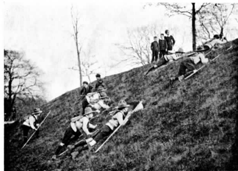
Развѣдчики пробираются по слѣдамъ.