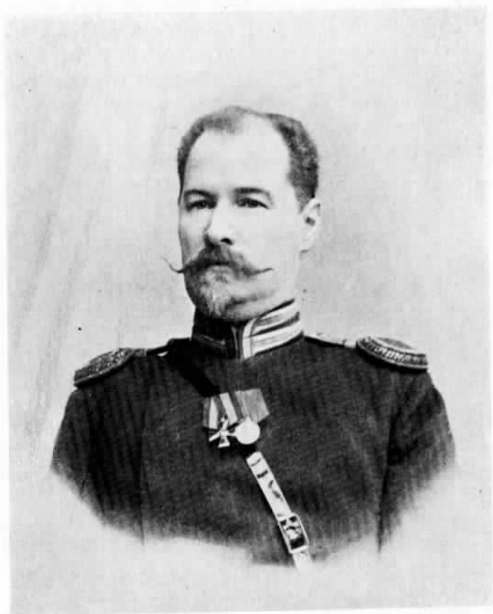
В. И. Роборовскій.