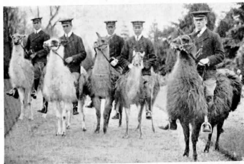
Несовсѣмъ обыкновенныя скаковыя животныя (ламы)!