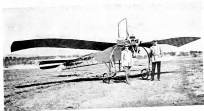
Монопланъ Блиндермана и Маіорова.