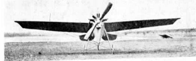
Новый монопланъ Эно-Пельтри. (Р. Е. Р. № 18).