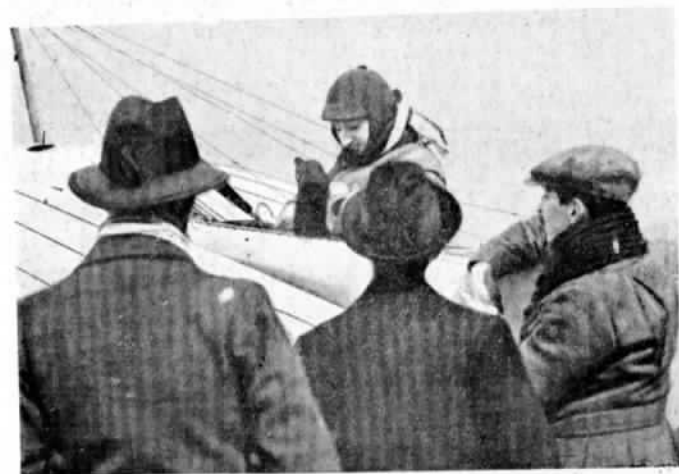
АНГЛІЯ. Пріе при отравленіи своемъ изъ Лондона. (Пріе совершилъ полетъ Лондонъ—Парижъ въ 3 ч. 56 м., безъ остановки).