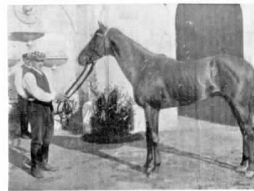
«Картачь» кн. Любомірскаго.