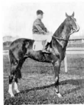
РОССІЯ. «Флореаль» М. И. Лазарева.