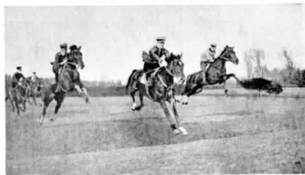
ГЕРМАНИЯ. Парфорсные скачки въ Карлсхорстѣ; впереди побѣдитель на «Файръ-Кингъ».