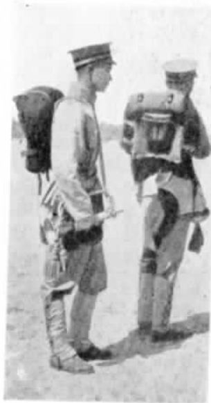
Сигналисты въ полномъ походномъ снаряженіи.