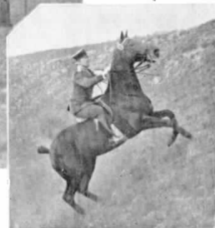
ГЕРМАНІЯ. Состязанія въ полевой ѣздѣ въ Грюнвальдѣ.

1. Побѣдитель Ротм. ф. Шликъ на «Орестъ».