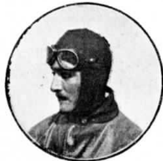
ВИДАРЪ (Vidart),—четвертый Парижъ—Римъ и третій въ Круговомъ Европейскомъ.