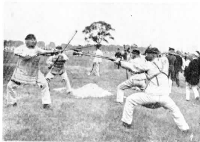
ГЕРМАНИЯ. Вой на штыгахъ.