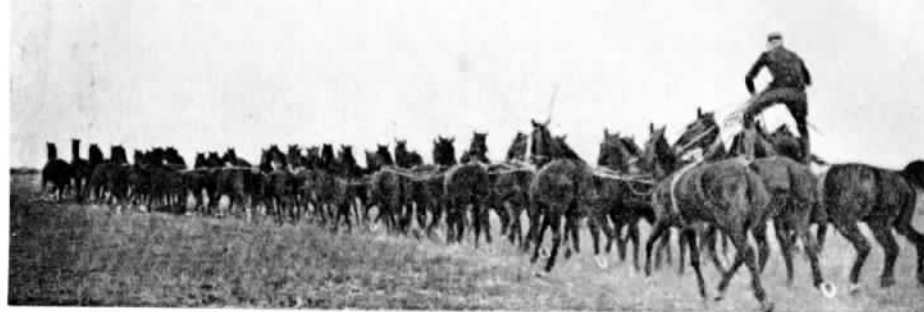
ФРАНЦІЯ. Лейтенантъ Аррето (29-го артилерійскаго полка) ведетъ галопомъ 40 лошадей.