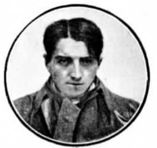
ГАРБА (Garba)—восьмой въ Круговомъ Европейскомъ.