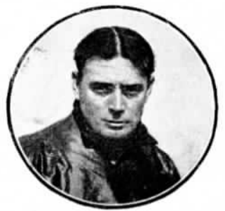
РЕНО (Varoux)—седьмой въ Круговомъ Европейскомъ.