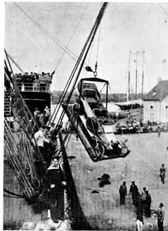
Автомобильныя состязанія въ Англии и Германіи. Отправка автомобилей изъ Бремена въ Соутгэмптонъ