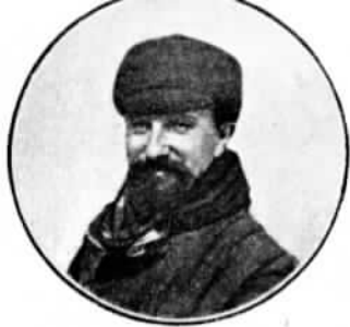
БОМОНЪ (Beaumont), взявший первые призы въ перелетахъ Парижъ—Римъ и Круговомъ Европейскомъ.