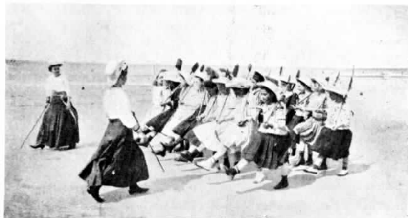
ГЕРМАНИЯ. Обученіе Боркумскихъ «потѣшныхъ дѣвочекъ».