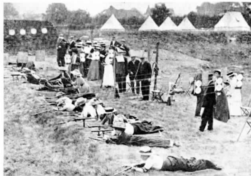
АНГЛІЯ. Дамскія стрѣлковыя состязанія.