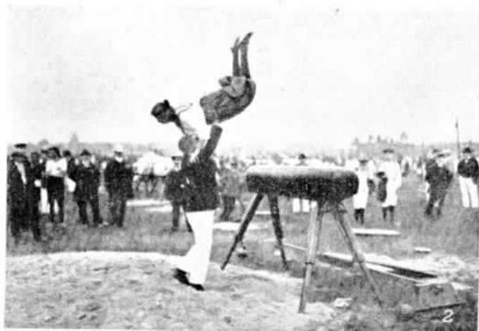
Рис. № 12.