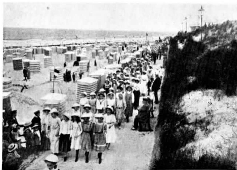
ГЕРМАНИЯ. Полкъ «потѣшныхъ» на пляжѣ.