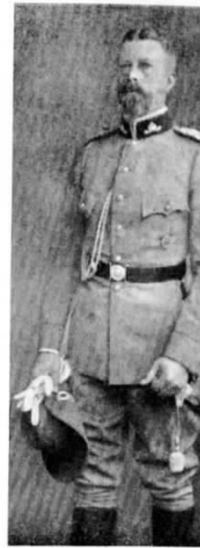
Принцъ Генрихъ Прусскій въ германскаго добровольнаго автомобильнаго корпуса.