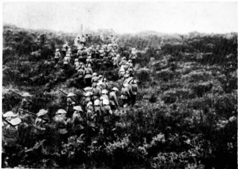
ГЕРМАНИЯ. Ученіе роты «потѣшныхъ» на дюнахъ.