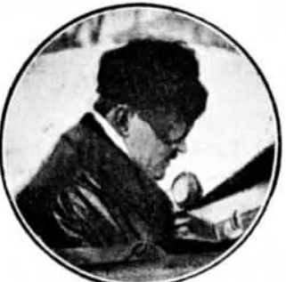
ЖИБЕРЪ (Gibert)—второй Парижъ—Мадридъ и пятый въ Круговомъ Европейскомъ.