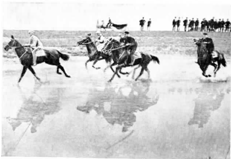
ГЕРМАНИЯ. Полевая скачка въ Магдебургѣ.