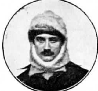
ГАРРО (Garros),—третій въ перелетѣ Парижъ—Мадридъ, второй Парижъ—Римъ и второй въ Круговомъ Европейскомъ.