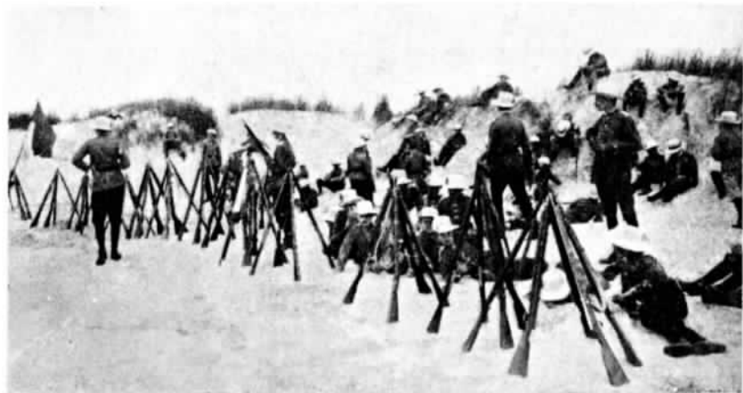
ГЕРМАНИЯ. Отдых Боркумских «потѣшныхъ» (Borkumer Jugendwehr) послѣ ученія.