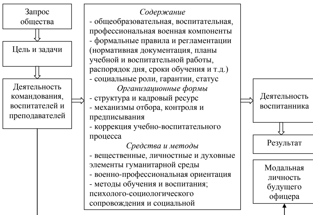
Рис. 1. Общая модель специализированного военного образования