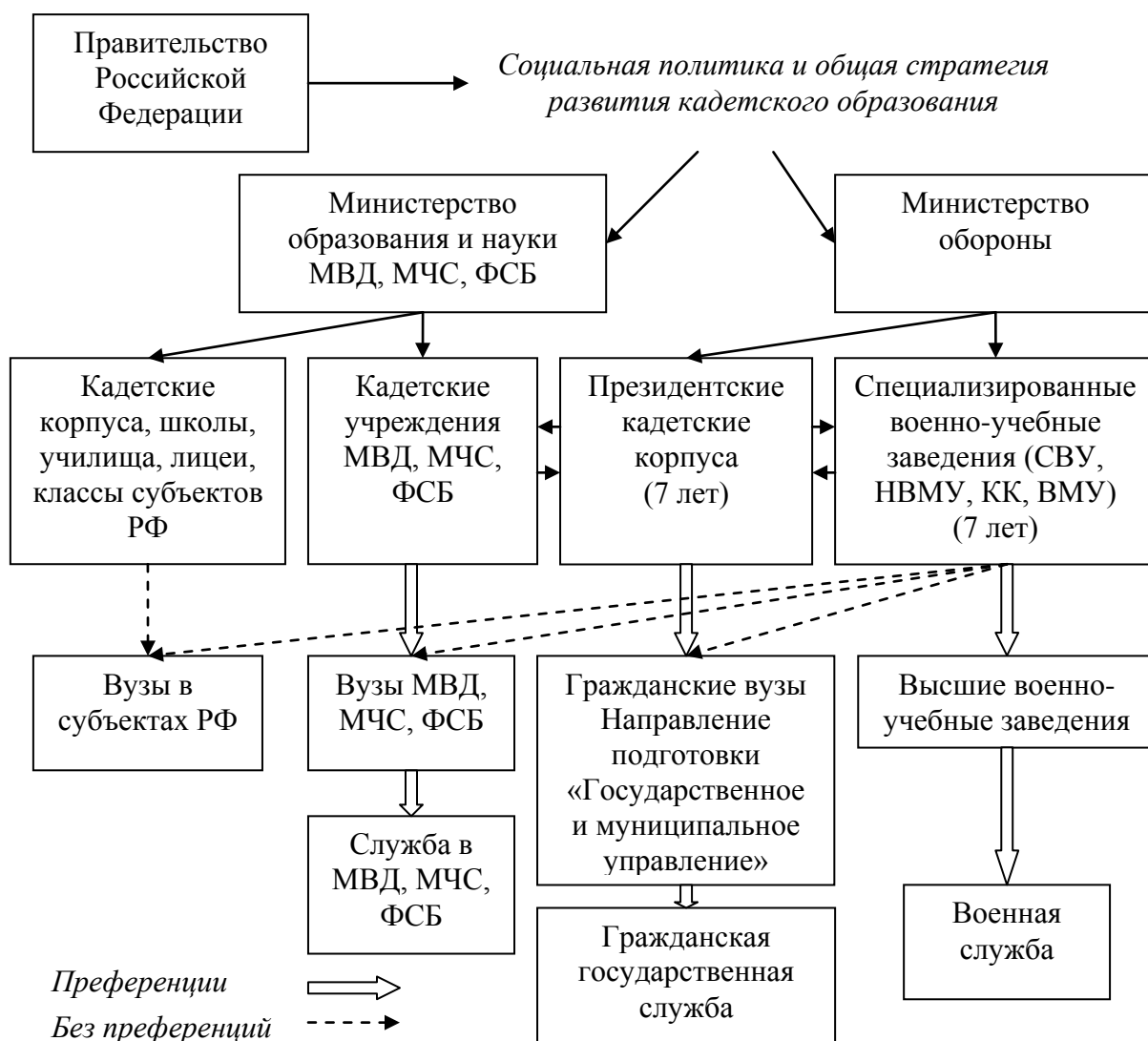
Рис. 3. Роль и место специализированного военного образования в структуре кадетского образования и социальной политике государства

Перспективы функционирования специализированного военного образования, закрепляющие ее в структуре кадетского образования и статистирующие выпускников, как социальную общность в структуре российского общества концептуально обосновываются, эмпирически подтверждается и формулируются следующим образом: