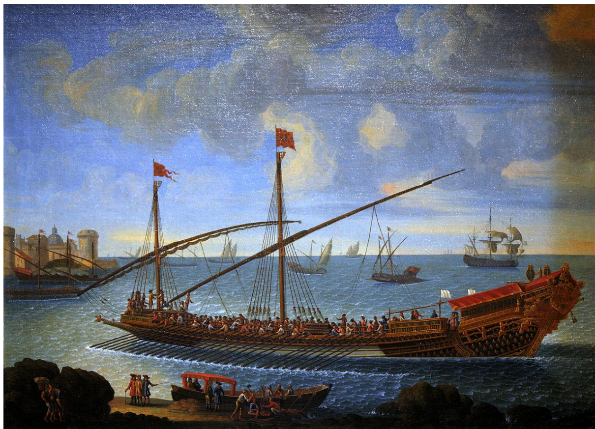
Рис. 1. Французская галера XVI века

для боя. Специалисты единодушны в том, что из всех кораблей, употреблявшихся в военных флотах всех наций, галера – самый совершенный тип гребного судна. Переходя из века в век, она, подвергаясь, конечно же, улучшениям, долгое время являлась единственным боевым кораблем, который знали флоты многих стран.