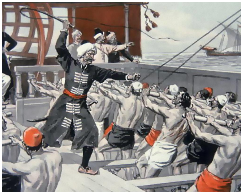
Рис. 4. «Стимулирование» подкомитом гребцов на турецкой галере

Много писалось и в то время, но особенно позже, о нечеловеческой доле галерников, однако картина голодных, забитых до полусмерти надсмотрщиками галерных рабов, по здравому размышлению, должна быть немного пересмотрена. Несомненно, галерное наказание было жестоким. Несомненно, число смертей от перенапряжения, тепловых ударов и, прежде всего, от воспаления легких было велико, так как низкосидящие галеры сильно заливало, и ничем не защищенные гребцы промокали до нитки. Но все другое едва ли соответствует правде. Питание, безусловно, было скверного качества, но количество еды вряд ли было недостаточным, иначе прикиньте, что может наработать на веслах полуголодный человек? [7].