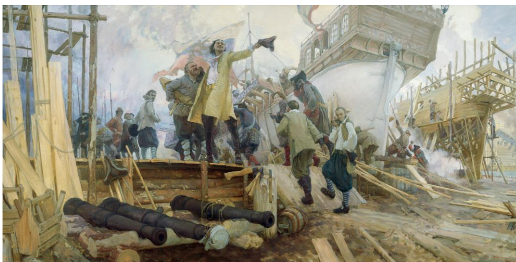
Рис. 5. Постройка русских галер

Интересный факт – на русских галерах команды гребцов формировались лишь из солдат и нанятых «работных людей», привлекались даже гвардейцы. Такой экипаж позволял действовать гребному флоту гораздо активнее, смелее и полностью использовать преимущества этого типа судов. Французский посол в России маркиз Жоакен Шетарди (Jacques-Joachim Trotti marquis de la Chétardie; 1705–1759) вынужден был признать, что «Петр Великий сумел внушить находившимся в его распоряжении войскам мысль о почете, связанным с должностью, обыкновенно выполняемой каторжниками. Даже гвардейцы считали для себя оскорблением не участвовать в гребле на перевозящей их галере, из чего проистекает, что галера, обычно у нас содержащая немного воинов, высаживает, пристав к берегу от 400 до 500 вооруженных людей» [8, 9].