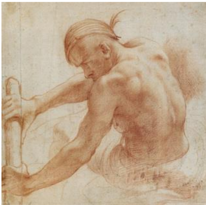
Рис. 2. Гребец-невольник. Рисунок Аннибале Карраччи, 1585

Добровольцы – лица, по каким-то причинам работавшие за жалование. Им тоже брили голову, оставляя для отличия бороду и усы. Как правило, на галеру нанимались разочаровавшиеся в жизни бедняки, бродяги, нищие, заключенные, отбывшие срок наказания, но не нашедшие себе места из-за своего прошлого. На ночь они приковывались, но днем свободно передвигались по галере. Добровольцы, а иногда и невольники свозились на берег для переноски припасов, но всегда ходили под конвоем. Добровольцы считались лучшими людьми из шиурмы, поэтому командиры галер всегда старались приобрести их для службы, но, увы, желающих было очень мало. Во время боя их обычно вооружали, и, поскольку настоящих солдат на галерах было совсем немного, они при abordage часто способствовали победе. Два первых разряда одевали за счет правительства, а добровольцы шили одежду из жалования (кстати, относительно высокого), и питались за свой счет вместе с экипажем [3, 4].