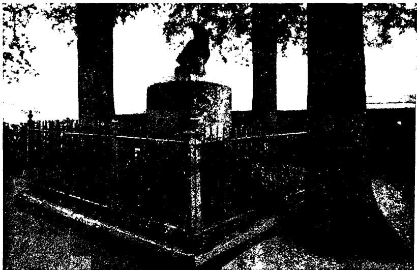
Рис. № 3.

смертельно раненъ, а именно на возвышенности къ ю.-з. отъ Рекница, имѣетъ видъ гранитнаго обелиска съ античнымъ шлемомъ, лавровымъ вѣнкомъ и мечемъ на верху; на памятникѣ слѣдующая надпись: «Moreau der Held fiel hier an der Seite Alexanders den XXVII August. MDCCCXIII».