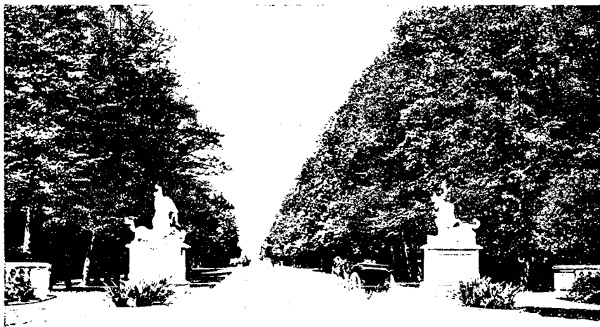
Рис. № 2.

паркъ съ широкими аллеями,—частью, конечно, въ тѣхъ же направленіяхъ, какъ и въ 1813 году 2) .