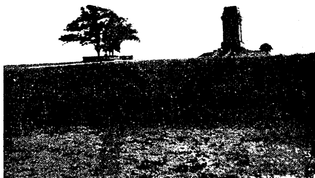
Рис. № 4.

Слѣва памятникъ генералу Моро, а справа, шагахъ въ 400-хъ—Бисмарку (Bismarks--säule), неизвѣстно по какой причинѣ поставленный на полѣ сраженія 1813 года.