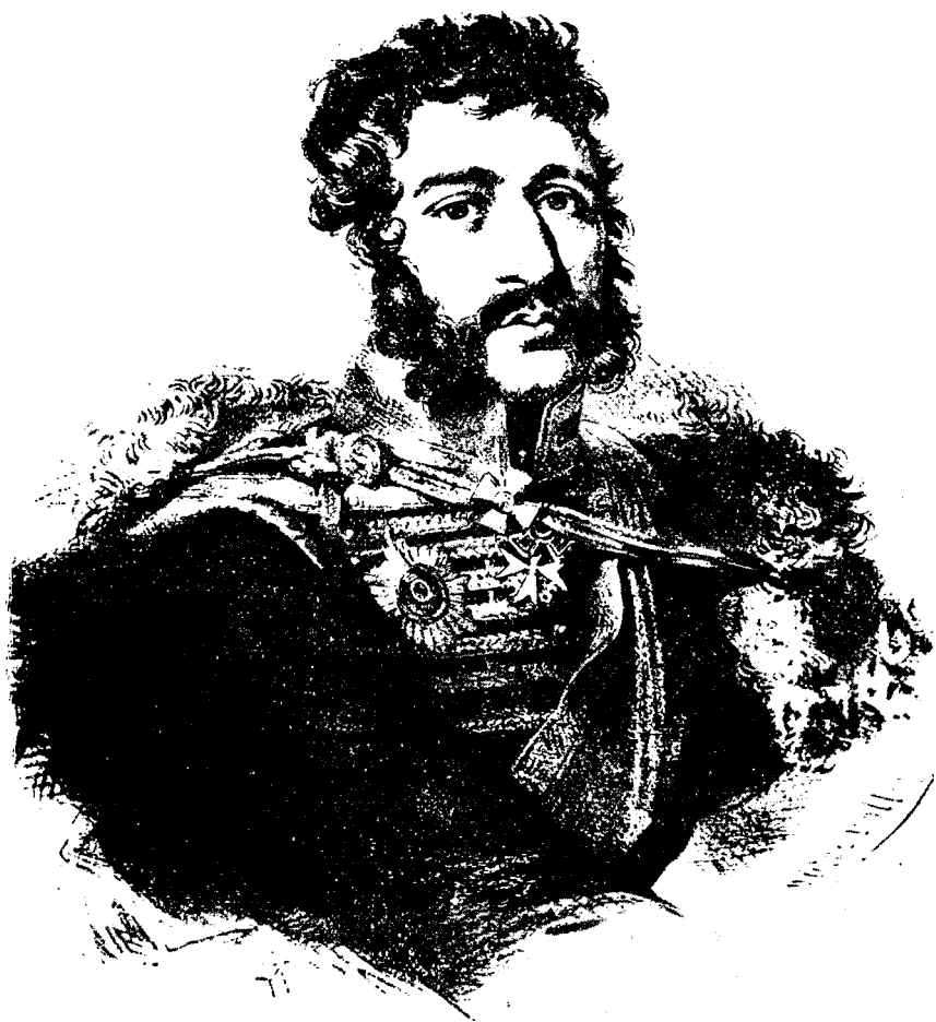
Яковъ Петровичъ КУЛЬНЕВЪ.