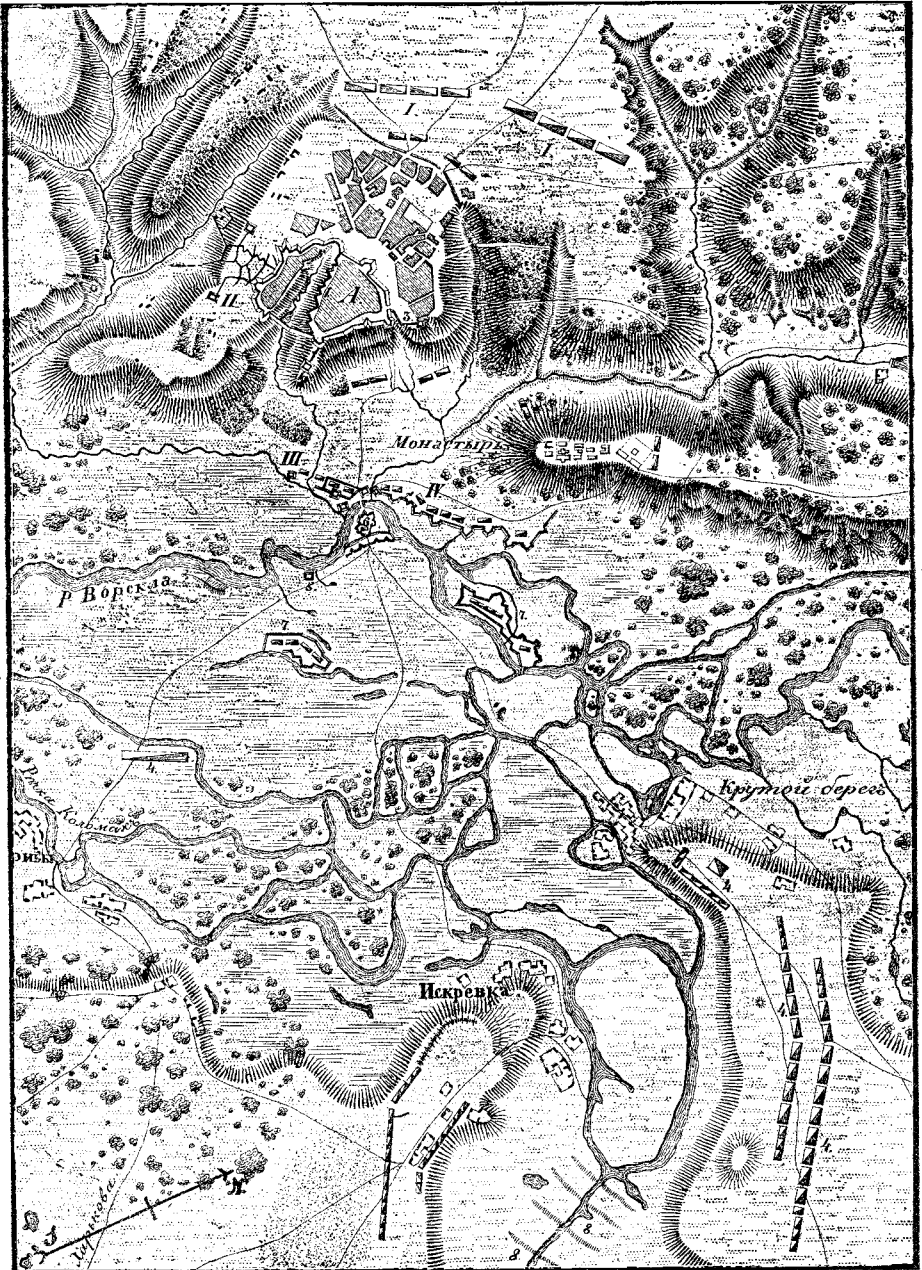
Планъ № 2