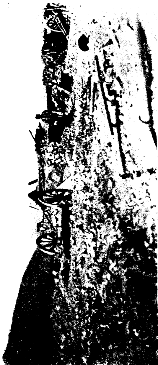
На Куропатинскомъ лугѣ.

Долго мы шли такимъ образомъ, то пригибаясь чуть не до земли, то выпрямляясь во весь ростъ. Особенно было плохо полковнику