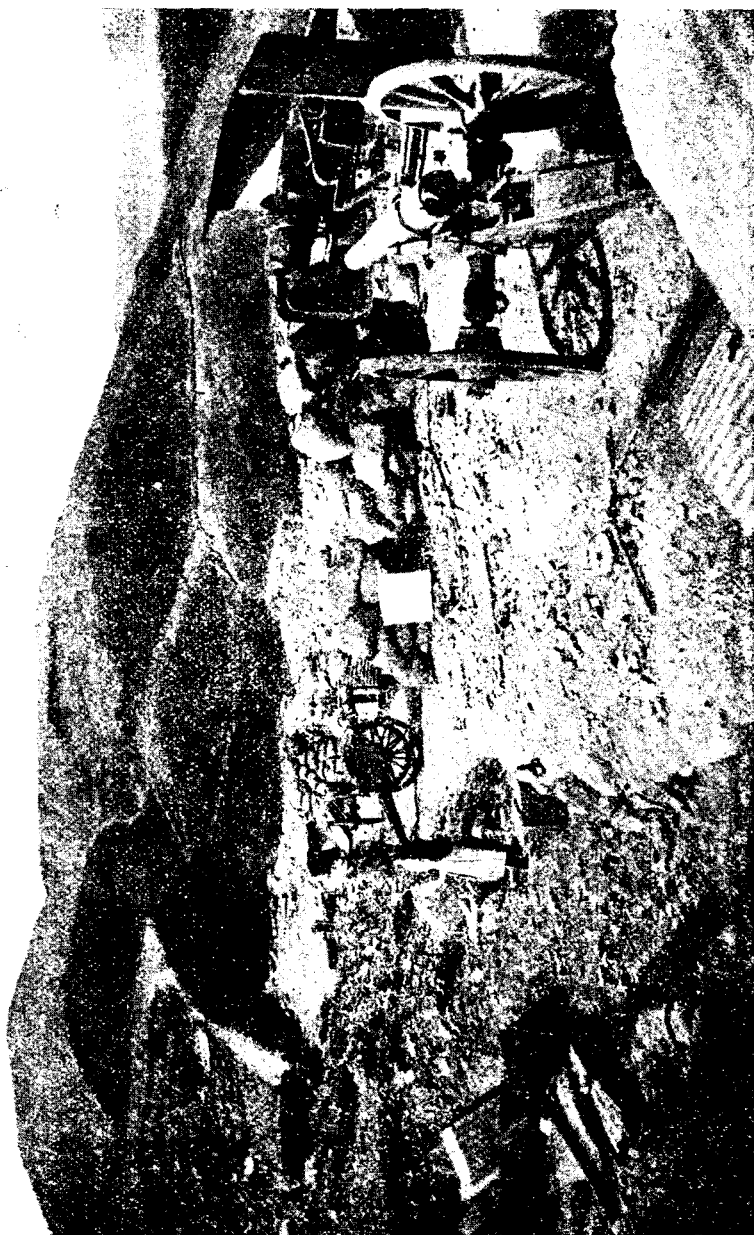
На Куропатинскомъ люнетѣ.

Вечеромъ 26-го октября получаю записку отъ ген. Кондратенко, въ которой онъ приглашалъ меня осмотрѣть минныя работы