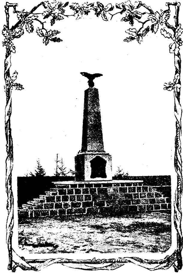
Видъ памятника у Пальцига.

эвакуированы въ Познань (русскіе) и Глогау (пруссаки) 1) . До 17-го іюля наша армія стояла лагеремъ на полѣ сраженія у Пальцига, имѣя бригаду князя Волконскаго у Кроссена.