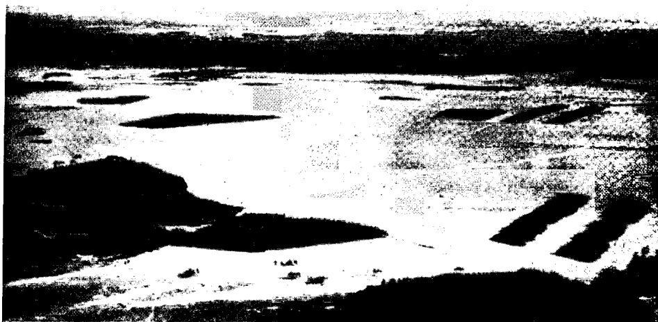
Рис. № 1. Снимокъ съ привязного шара: высота подъема 420 м.; сильное неровное освѣщеніе; снимокъ сдѣланъ въ началѣ іюня въ 7 ч. 30 м. утра. Вертикальная стрѣлка указываетъ мѣсто расположенія тяжелой артилеріи въ 7200 м. удаленія.