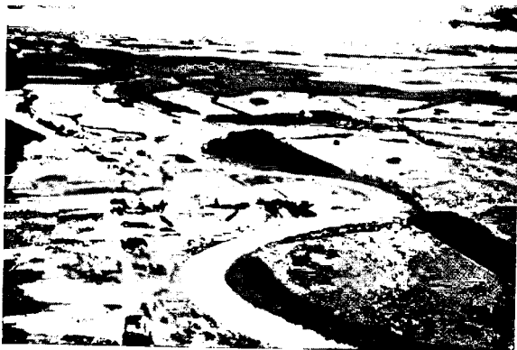
Рис. № 3. Снимокъ со свободнаго шара: высота подъема 380 м. очень благоприятное освѣщеніе; снимокъ сдѣланъ въ серединѣ іюля въ 1 ч. дня. Развѣдка линіи рѣки (Варты сѣв. Познани).