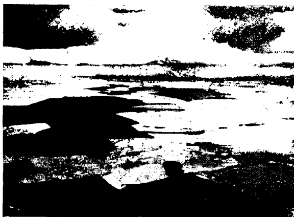
Рис. № 5. Снимокъ со свободнаго шара: высота подъема 750 м.; необыкновенно сильные контрасты освѣщенія; снимокъ сдѣланъ въ концѣ іюля въ 5 ч. 30 м. дня, передъ грозой.