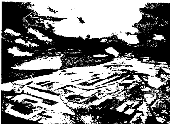
Рис. № 4. Снимокъ со свободнаго шара: высота подъема 1050 м.; снимокъ сдѣланъ въ серединѣ іюля въ 3 ч. дня, въ просвѣтъ между облаками.