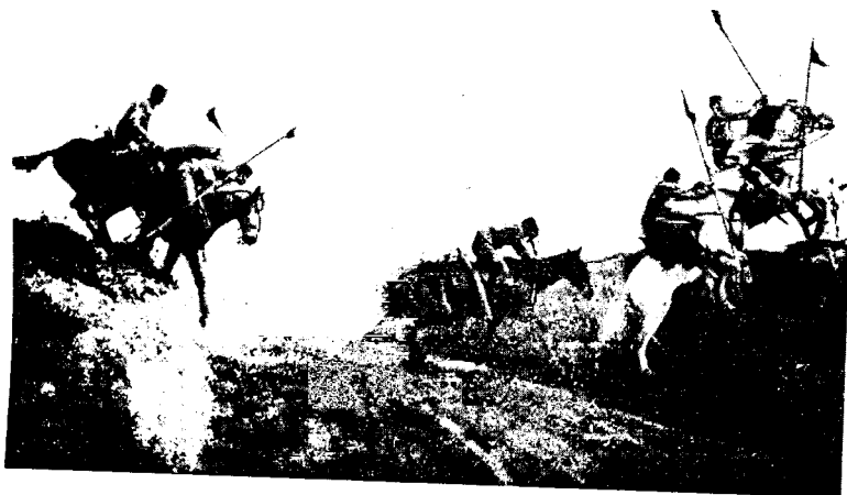
ПОРТУГАЛІЯ. Полевая ѣзда кавалеріи.