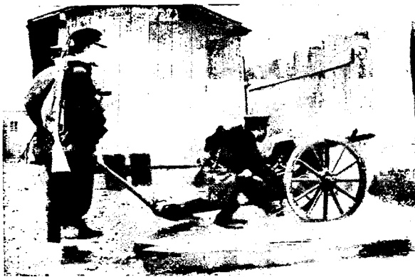
КИТАЙ. Полевая артилерія войскъ революціонеровъ.