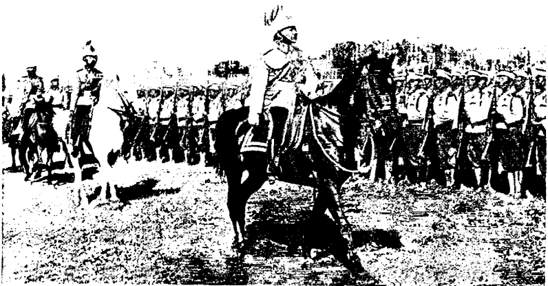
СИАМЪ. Смотръ войскамъ въ Бангкокѣ новымъ королемъ; за нимъ на конѣ принцъ Чакрабонъ.