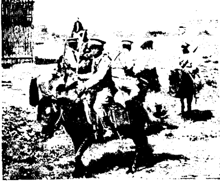
КИТАЙ. Конный дворъ правительственныхъ войскъ.