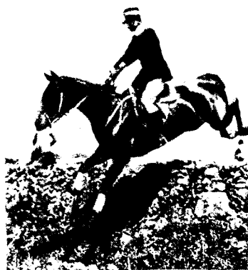
ИТАЛІЯ. Подполковникъ гр. Пандольфи, начальникъ школы Торь-ди-Квинто, на прыжкѣ черезъ стѣну.