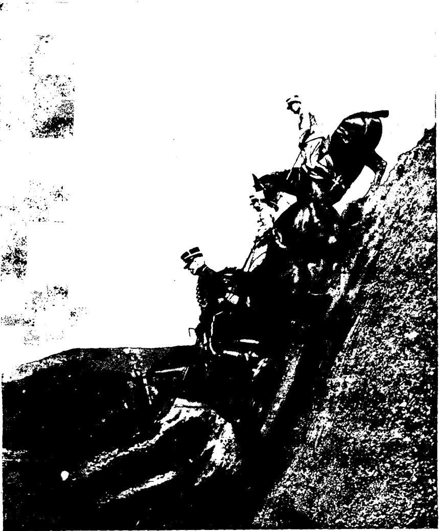
ИТАЛИЯ. Спускъ въ оврагъ (школа Торъ-ди-Квинто).