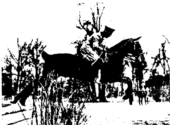
ГЕРМАНИЯ. На утренней проѣздѣ въ Берлинскомъ Тиргартенѣ.