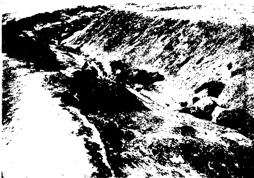
Эта фотографiя подтверждаетъ правильность теоретическаго расчета «по одному человѣку на одну погонную сажень форта».

линъ, и временами совершенно скрывались въ огнѣ и дымѣ. На каждой погонной сажени линiи огня фортовъ въ среднемъ оказалось по одному убитому защитнику. Но зато много горя намъ причинили пулеметы, поставленные въ промежуткѣ между Айвазъ-баба и Айджи-юлу. Какъ оказалось впоследствии, на гребнѣ имѣлись незасыпанная ямы и старыя брошенныя батареи; ими и воспользовались турки, какъ огневые позиціи. Скорѣе всѣхъ захватили фортъ Айджи-юлу. До ручныхъ гранатъ и доштыка нигдѣ не доходило. Мы не находили живыхъ людей на фортахъ. Остальные форты восточнаго сектора были брошены ихъ защитниками,