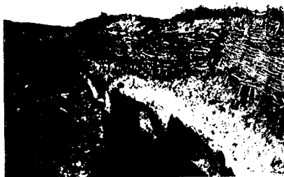
Болгарскій окопъ съ нишами отъ шрапнели гаубицъ.

Если вы займете мѣсто въ окопѣ, изъ котораго нельзя выйти до наступленія темноты, то уже одна эта обязанность сидѣть будетъ вредно отзываться на вашемъ настроеніи. И это настроеніе рѣзко измѣнится къ лучшему, какъ только вы получите свободу передвиженія. При такомъ только условіи возможно подпускать противника почти до самаго окопа; иначе либо окопъ будетъ брошенъ заблаговременно, либо люди будутъ настолько подавлены, что стрѣльба ихъ будетъ бесполезна. Вѣдь, пока противникъ далеко, вы можете своихъ людей разомкнуть хотя бы на 3 шага другъ отъ друга, каждый изъ нихъ сохранить еще способность ставить при-