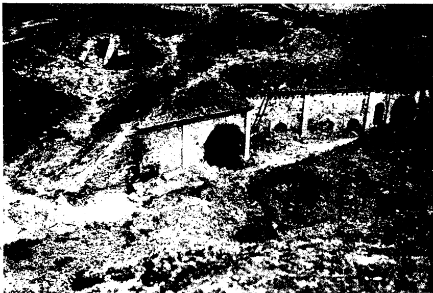
Фортъ Айвазъ-баба послѣ бомбардировки.

Итакъ, задача фортификаціи — «облегчить веденіе боя на мѣстности», на которой быть можетъ будетъ атака непріятеля. Только при такомъ рѣшеніи вопроса можно подготовить позиціи на десять верстѣ, а занимать войсками и драться на одной верстѣ. Только при такихъ условіяхъ возможно подобное приказаніе: «Противникъ захватилъ NN; выбейте его контръ-атакой, но такъ какъ мѣстность на позиціи уже была подготовлена для боя, то, вмѣсто четырехъ баталіоновъ, я вамъ даю только одинъ».