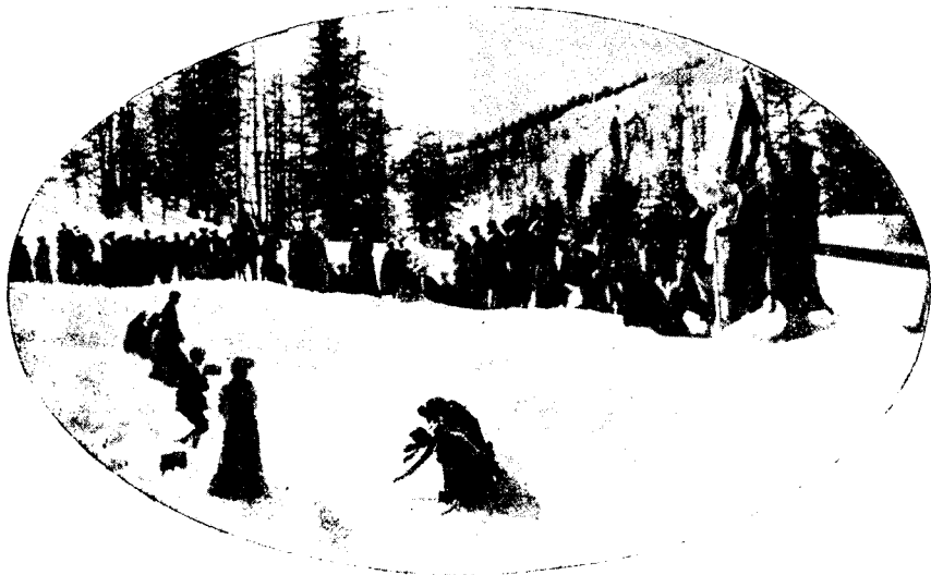
С. МОРИЦЪ. Катанье съ горъ; на заворотѣ.

Ну, а у кого побольше досуга, тѣ на цѣлыя недѣли переключаются въ горы, въ излюбленные и подготовленные для зимняго спорта мѣста: тамъ устраиваются состязанія, экскурсіи и т. п. въ самомъ широкомъ размѣрѣ.