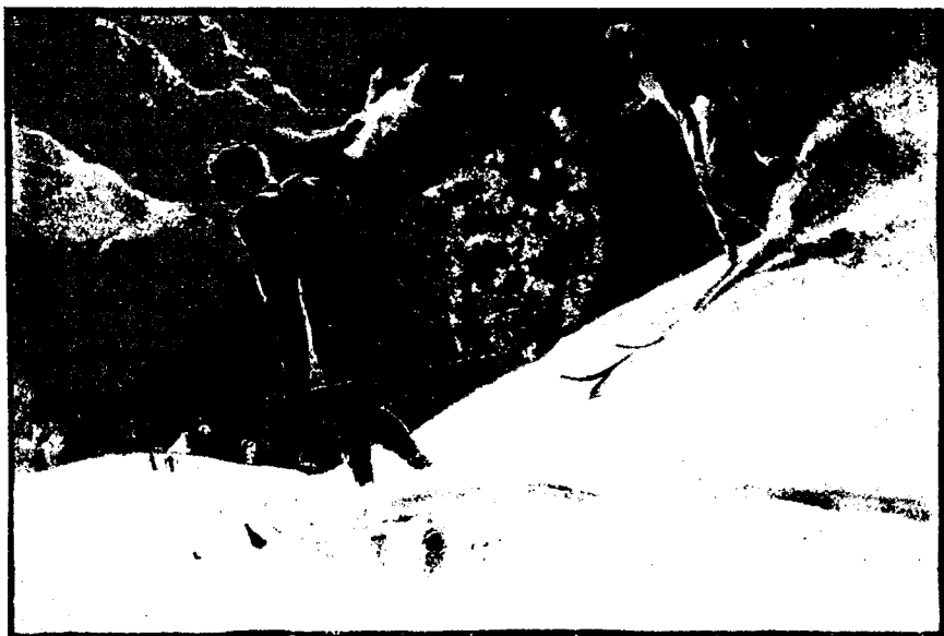
ВЪ ШВЕЙЦАРІИ. Зимой, катанье съ горы.

У насъ же, если и есть спортивные общества, то по преимуществу штатскія; военныхъ что-то не видно. А какъ хорошо было бы имѣть послѣднія и тѣмъ самымъ пойти навстрѣчу офицерству въ заполненіи ихъ досуговъ спортомъ!