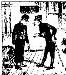
Son capitaine, pour la première fois, lui adresse une sévère réprimande.