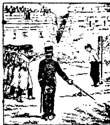
Et il est fusillé!... Voilà, enfants, où peut conduire l'alcool.

3) Народная (зубочная) картинка («Imagerie d'Épinal») — «Pierre l'Alcoolique»: 16 картинокъ, представляющихъ участь