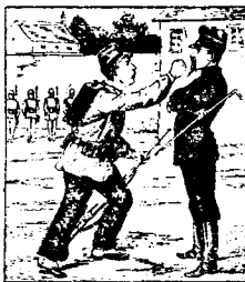
Sous l'empire de l'ivresse il frappe un supérieur dans le service.