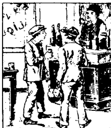
Ses parents lui font apprendre le métier de charpentier; en sortant de l'atelier il va boire avec ses camarades chez les marchands de vin.