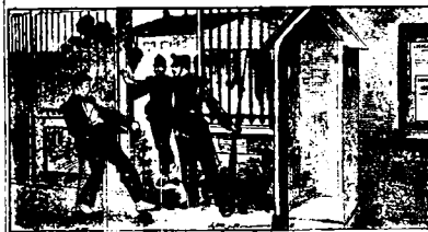
2. — LA VIE INTÉMPÉRANTE. — L'ivrogne est un mauvais soldat comme il a été un mauvais ouvrier. En rentrant à la caserne en état d'ivresse, il se rend passible de la prison.