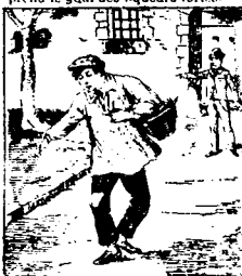
Son patron se fatigue de sa mauvaise conduite et le chasse bonnement.