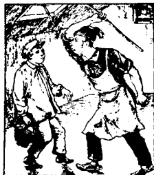
Un jour il rentre à la maison complètement ivre; son père prend un bâton et le corrige.