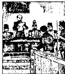
Traduit devant un conseil de guerre, il est condamné à la peine de mort.