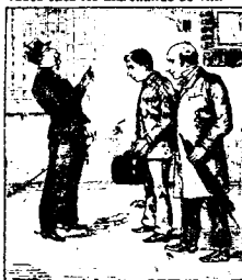
Son père alors l'engage comme soldat, espérant que la discipline militaire le corrigera.