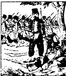
Mais l'alcool au contraire lui enlève son énergie, et, incapable de suivre la colonne, il doit s'arrêter.