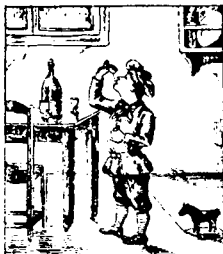
Petit Pierre malgré la défense de ses parents, boit le fond des verres restés sur la table. De cette façon il prend le goût des liqueurs fortes.