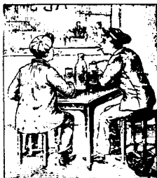
Peu à peu il abandonne l'atelier pour le cabaret.