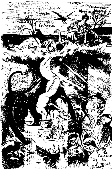
Рис. № 6.

бываютъ свой доль и дѣлаетъ его дурнымъ солдатомъ. Рис. № 4 (а и б) (стр. 152).