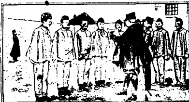
1. — LA VIE SOBRIE — Devant le fléau de l'alcoolisme, le ministre de la Guerre a interdit la vente des liqueurs alcooliques à la cantine.

L'antialcoolisme enseigné par l'image. N° 15