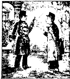
Mais là encore il trouve moyen de se procurer de l'eau-de-vie. Surpris par un chef, il est sévèrement puni.