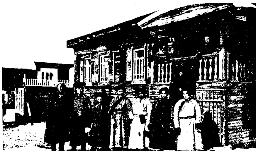
Урянхайскіе чиновники въ селѣ Верхне-Усинскомъ.

Одѣты были гости въ бѣлыхъ халатахъ изъ бараньихъ шкуръ, богато расшитыхъ чернымъ плисомъ, въ собольихъ шапкахъ, украшенныхъ цвѣтнымъ шарикомъ и малиновыми лентами, въ вышитыхъ разноцвѣтными узорами китайскихъ сапогахъ съ остроконечными носками—такіе, вѣроятно, носились у насъ стрѣльцами до Петровскаго времени.