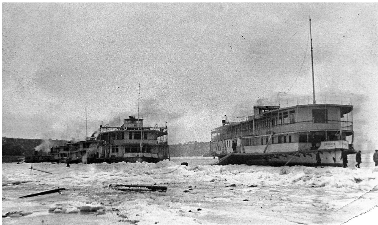
Рис. 11. Пароход «Дюканов» во льдах, за ним заднеколесный пароход «Жемчужина»