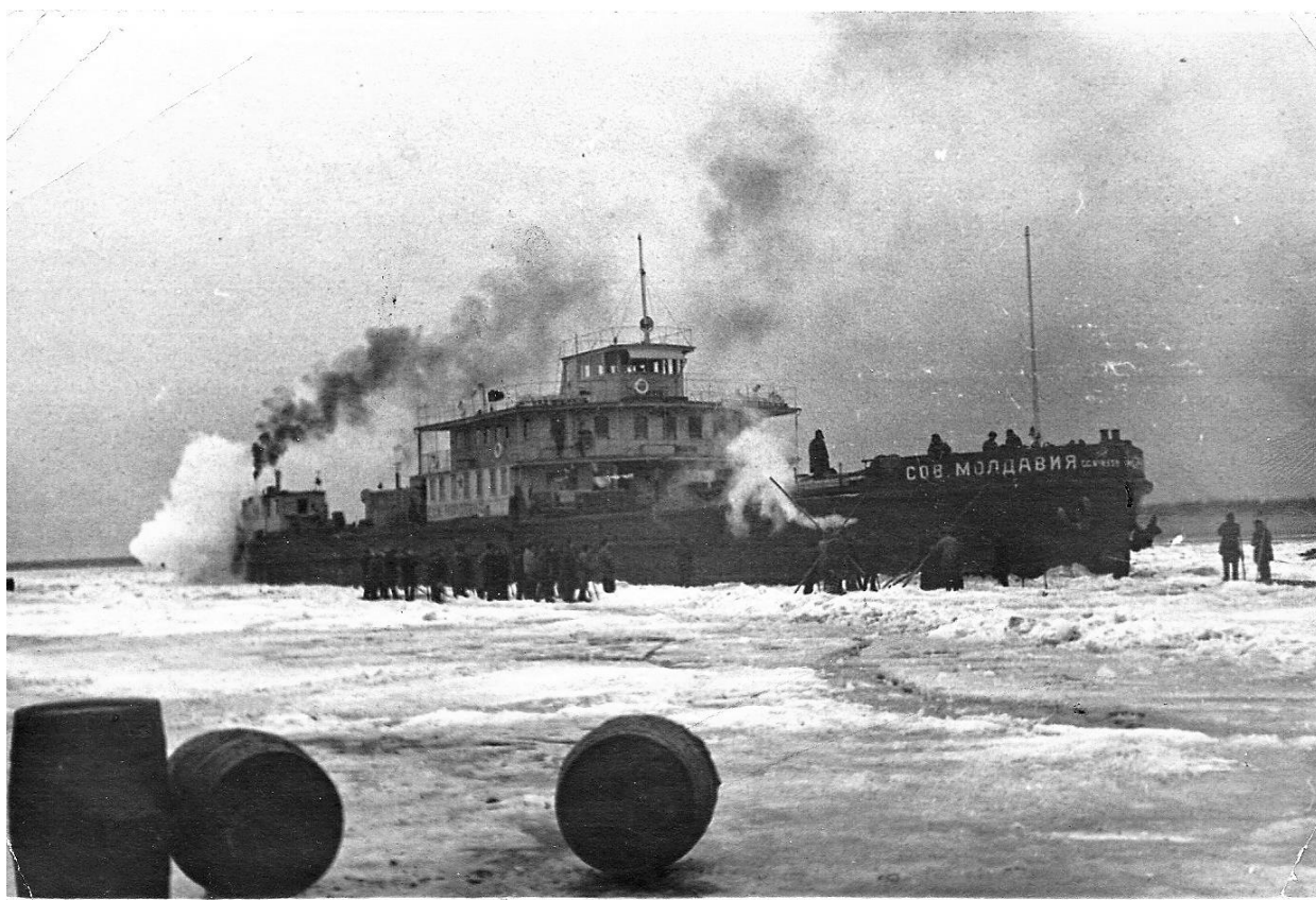
Рис. 14. Сухогруз «Советская Молдавия» тоже имел железный корпус и мог таранить лед