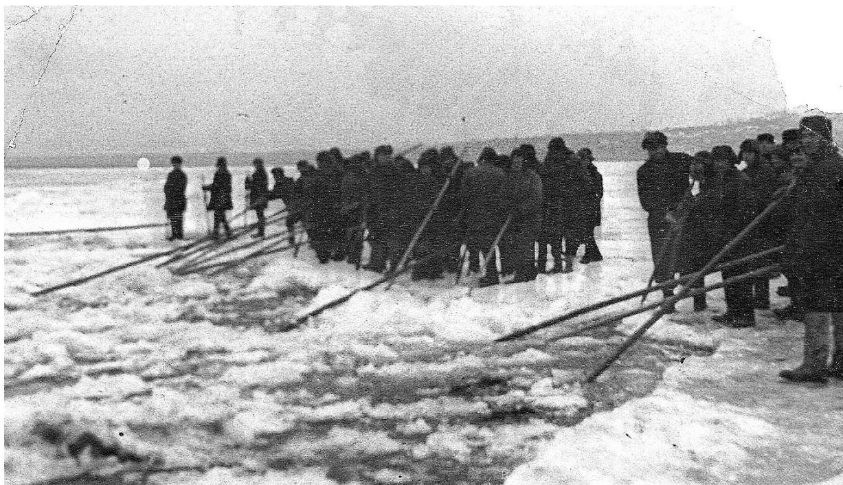
Рис. 7. Люди на льду пытаются баграми отогнать по течению расколотый лед, чтобы расчистить полынью для прохода каравана