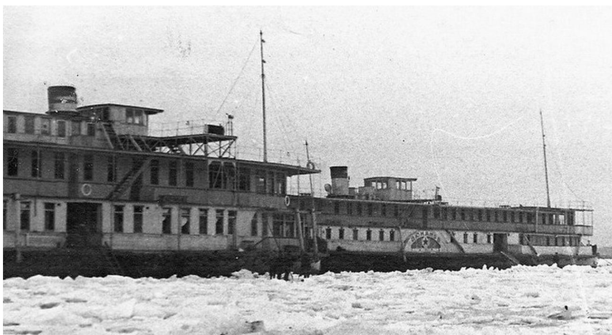
Рис. 12. «Дюканов» и «Жемчужина» с другого ракурса