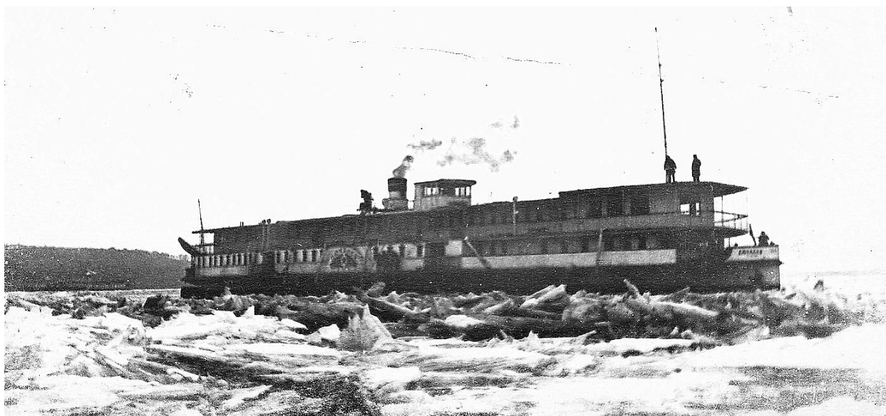
Рис. 8. Пароход «Дюканов» во льдах. Он единственный из каравана обладал железным корпусом и железными плицами на колесах, что и позволяло ему успешно крушить льды