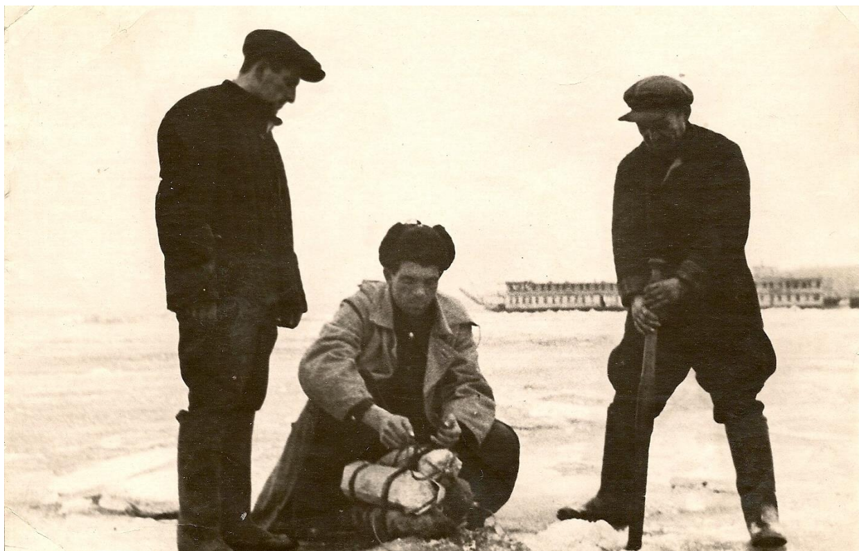
Рис. 3. Идет закладка зарядов для расколки льда, на заднем плане вероятно «Дюканов»