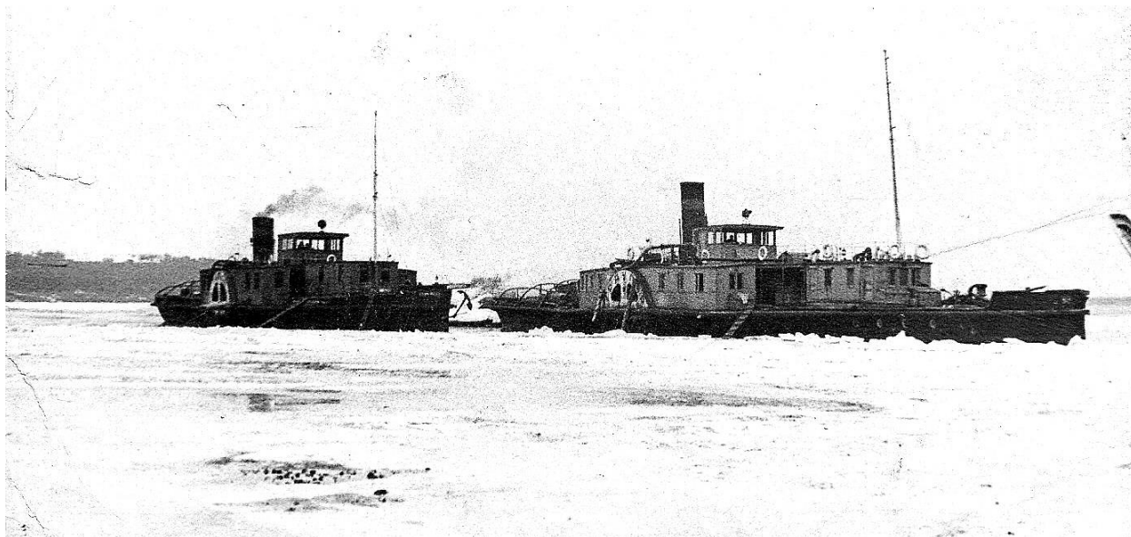
Рис. 9. Буксирные суда «Траулер» (впереди) и «Фауст» во льдах, скорее всего в районе Чистополя