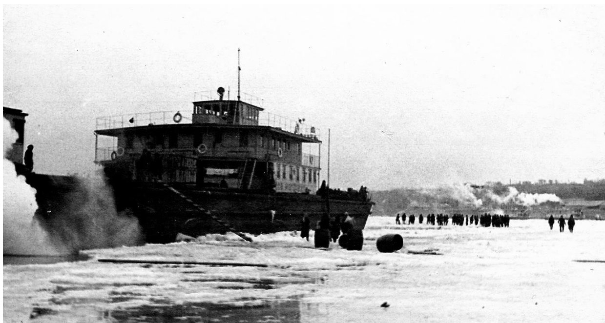
Рис. 13. Идет выгрузка на лед с борта «Советской Молдавии» грузов в бочках, команды уже на льду