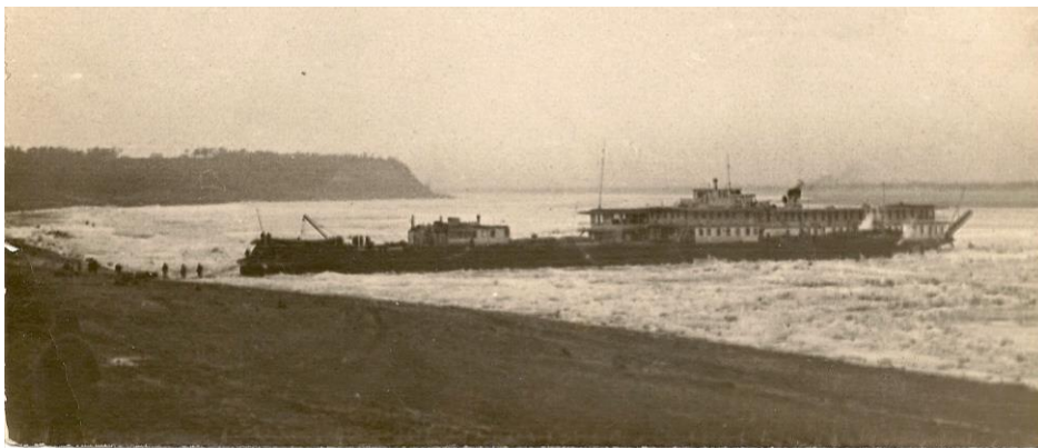
Рис. 17. Тоже фото с другого ракурса