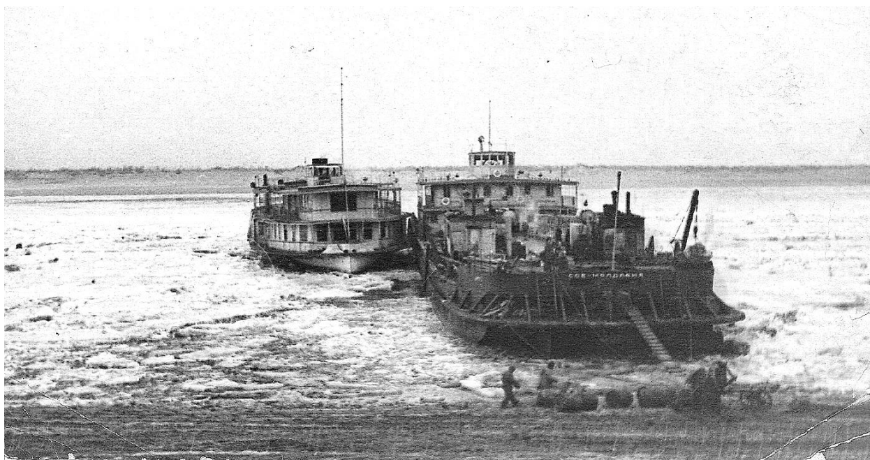
Рис. 16. «Советская Молдавия» у берега, на который перекинут трап, возможно идет разгрузка