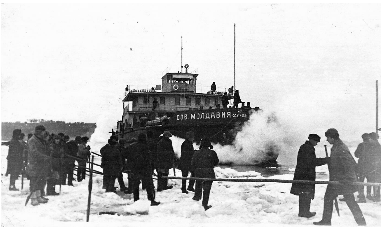
Рис. 6. Сухогруз «Советская Молдавия», люди на льду имеют в руках специальные ломы, которыми пробивают лед для измерения его толщины, выскивая более тонкий для проводки судна