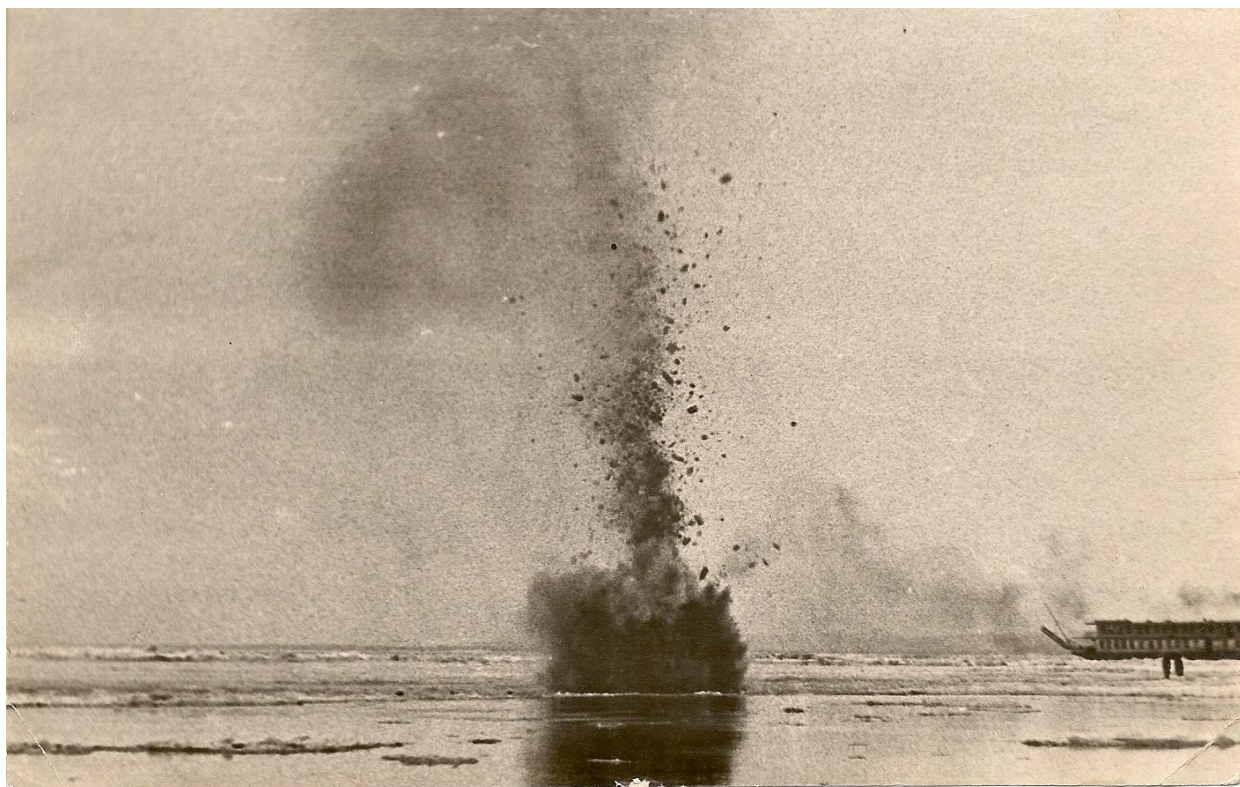
Рис. 4. Взрыв льда. Справа, вероятно, «Дюканов»