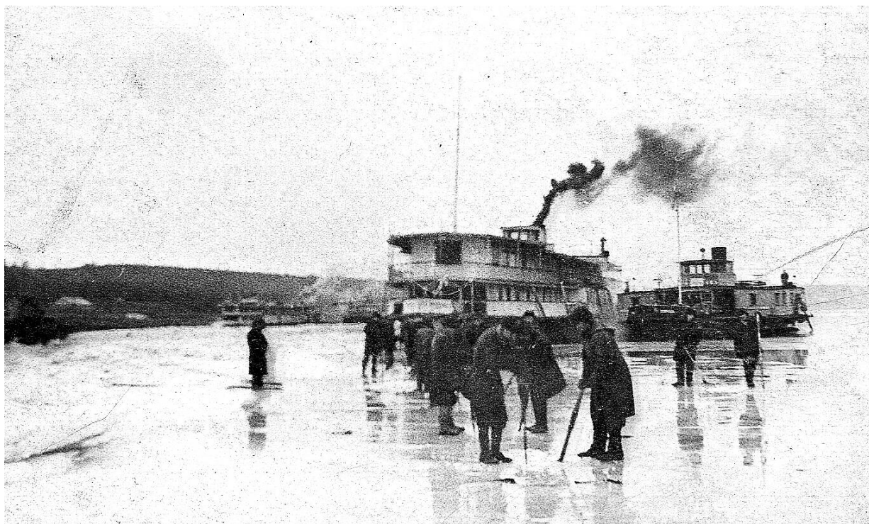
Рис. 15. «Дюканов» впереди, за ним «Траулер», люди на льду замеряют толщину льда