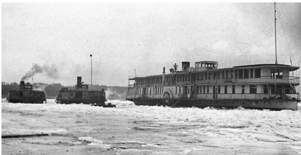
Рис. 10. «Дюканов» (впереди), далее «Траулер» и «Фауст» в камских льдах