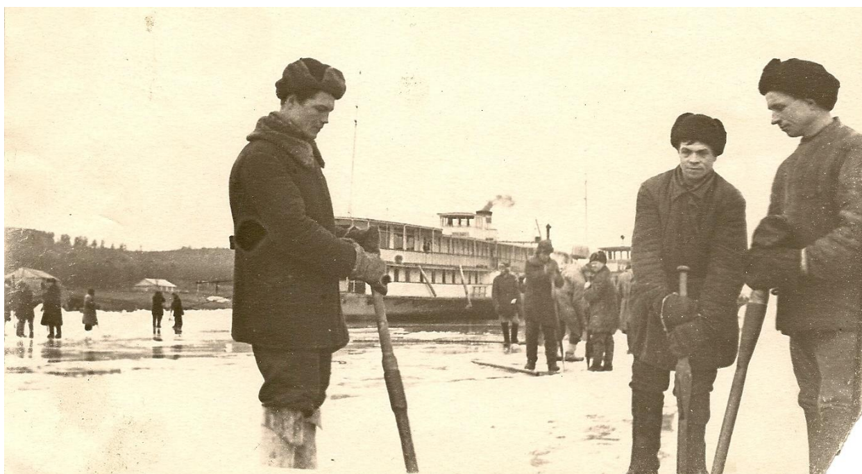
Рис. 2. Группа для закладки взрывчатки во льдах, на заднем плане «Дюканов»