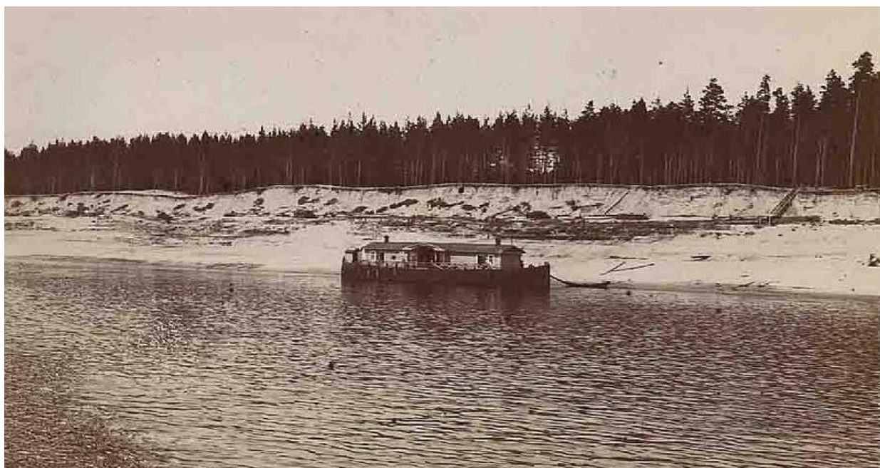
Рис. 1. Дачная пристань у Нижней Курьи в начале зимы, 1920-е гг.