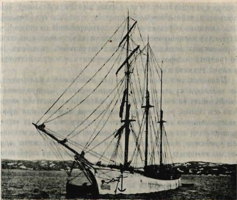
Поморское судно для дальняго транспорта соленой рыбы (въ Балтійскіе порты).