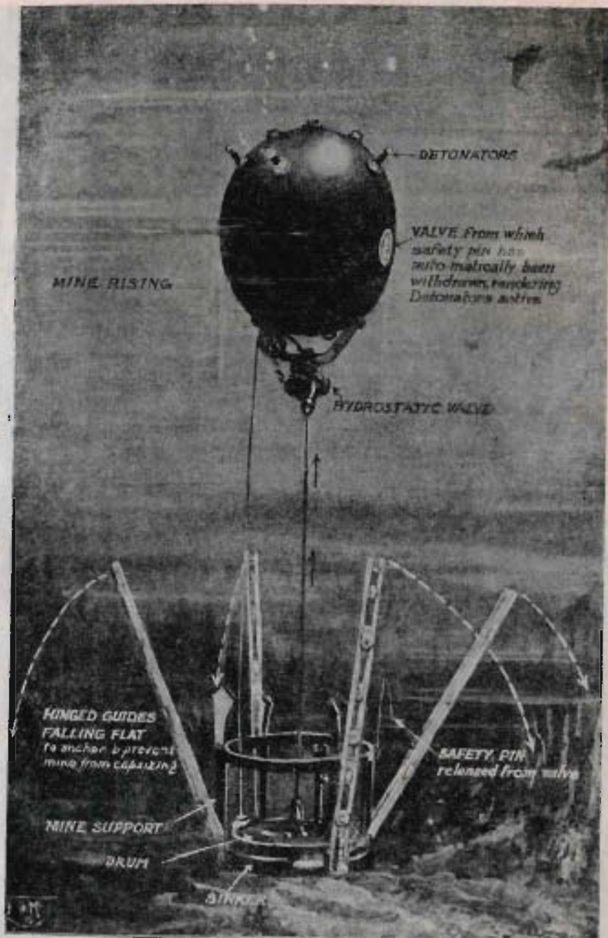
Германская мина заграждения, выбрасываемая подводною лодкою.