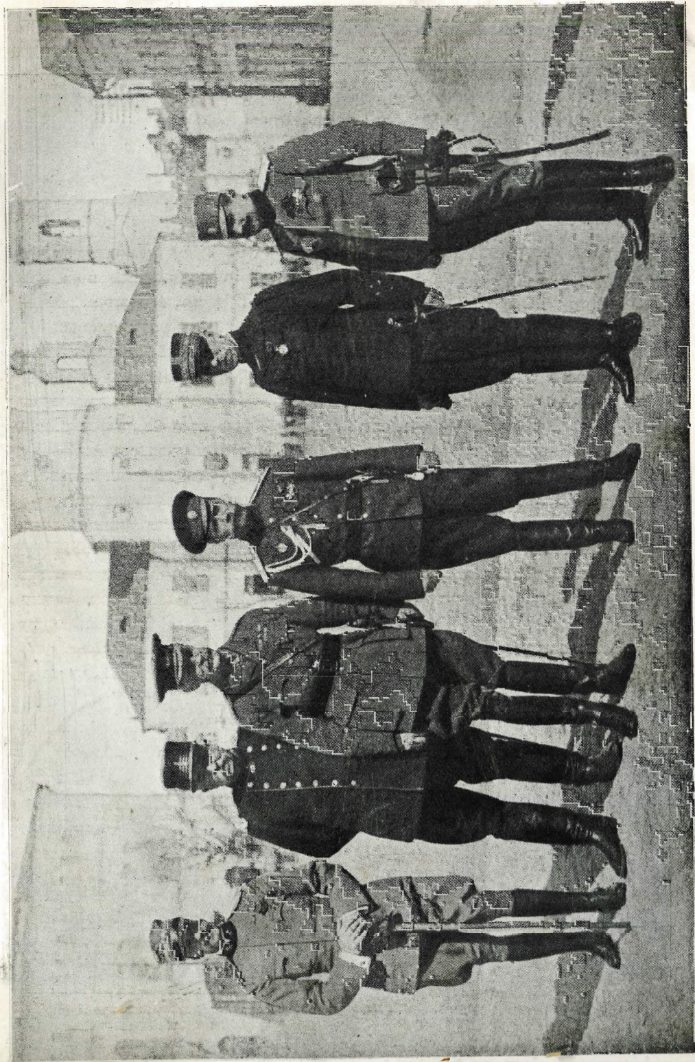
ГОСУДАРЬ ИМПЕРАТОРЪ въ Ставкѣ среди военныхъ представителей Союзныхъ Державъ.