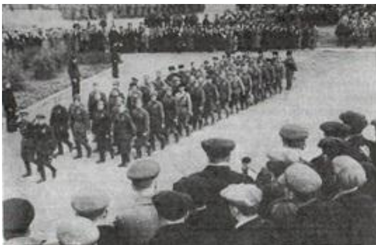
Рис. 4. Партизанский отряд «Боевой клич» на параде 8 октября 1944 г. в Петрозаводске