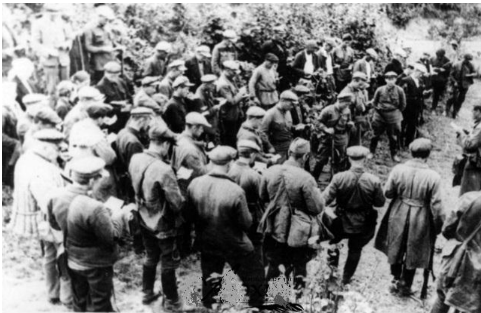
Рис. 1. Партизаны отряда «Боевой клич» принимают присягу перед первым походом. Окрестности Кестеньги. 1941 г.

В интернете была обнаружена одна из немногочисленных фотографий, имеющая непосредственное отношение к отряду «Боевой клич» (Рисунок 1).